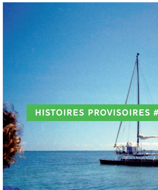
HISTOIRES PROVISOIRES #1

Le manger pour cœur – La Maison du Conte Réservation | 01 49 08 50 85 | Tarif 15€ (repas compris)