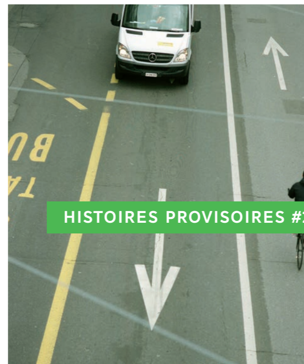
HISTOIRES PROVISOIRES #2